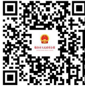
临汾市人民政府公报

主管主办单位:临汾市人民政府办公室 编辑印发单位:临汾市政府公报编辑中心 地址:临汾市解放西路市府街 电话:(0357)2091150